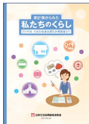
2016年 全国生計費調査報告書

そこで、当研究会では日本生協連が実施する全国生計費調査の調査結果を踏まえながら、家計簿の役割や意義について研究者の視点から整理し、近年普及しつつある家計簿アプリの実態について開発担当の方にお話をさせていただきます。また、2018年から開始される日本生協連の『家計・くらしの調査』についての紹介もあります。家計簿の価値を確認しつつ、これからの家計簿はどうあるべきかを考える良い機会ですので、是非ともご参加ください。